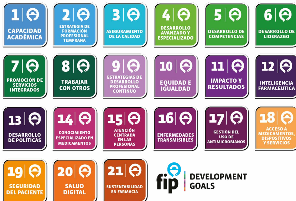
Figura 1. Los objetivos de desarrollo de la FIP para transformar la farmacia a nivel global

Además, un marco sistemático e integrado facilita el seguimiento mundial de las tendencias y apoya un tablero de mando mundial para supervisar los avances en la atención farmacéutica, la educación, la ciencia aplicada y el impacto sanitario nacional. Por último, las Directrices Generales de la FIP constituyen una base para compartir las mejores prácticas, tanto en un contexto mundial como nacional, y fomentarán y alentarán la cohesión, la solidaridad y la acción concertada a nivel mundial. Esto es, y seguirá siendo, un trabajo en curso para la próxima década.