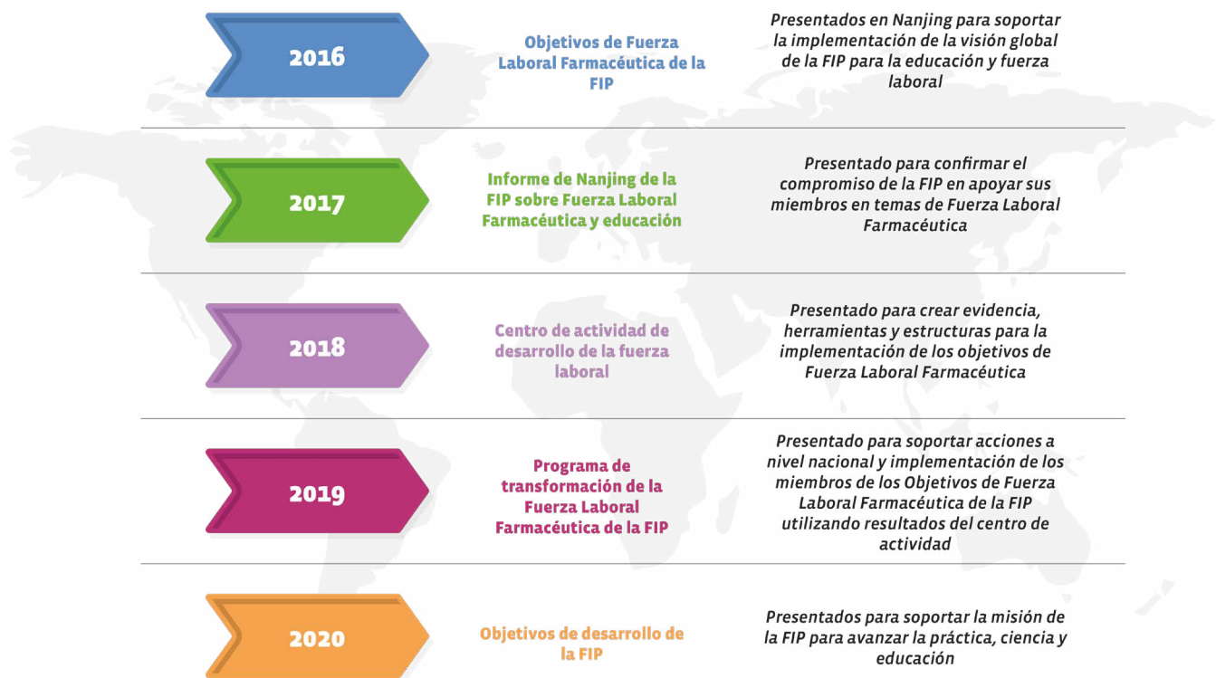
Figura 2. El desarrollo des de los Objetivos de Fuerza Laboral Farmacéutica de la FIP hasta los Objetivos de Desarrollo de la FIP

Disponer de un conjunto de objetivos de desarrollo de “ONE FIP” nos permite identificar puntos comunes en todas las áreas de la FIP, así como algunos atributos únicos en cada área. Creemos que es imperativo reunir la ciencia, la práctica y la fuerza de trabajo y la educación en un marco transformador para nuestros miembros y la profesión en general para establecer claramente los objetivos de desarrollo para la próxima década.