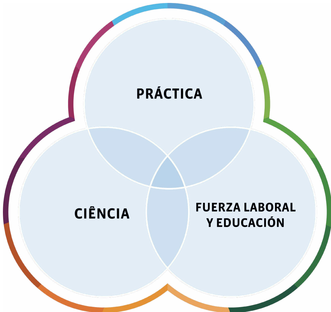
Figura 3 Los objetivos de desarrollo de la FIP pretenden transformar la ciencia farmacéutica, la práctica, la fuerza laboral y la educación.

La FIP cree que no podemos tener una atención farmacéutica sin un personal farmacéutico, y no podemos tener una atención farmacéutica sin una base científica (Figura 3).