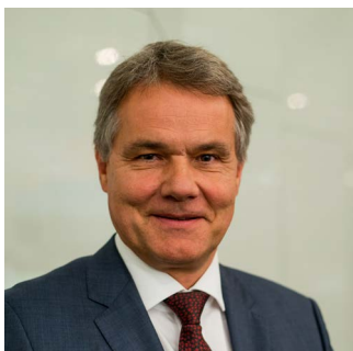
Dominique Jordan Presidente de la FIP

Con los Objetivos de Desarrollo de la FIP, ésta se propone transformar la farmacia mundial trabajando en asociación y colaboración con nuestros miembros en todo el mundo.